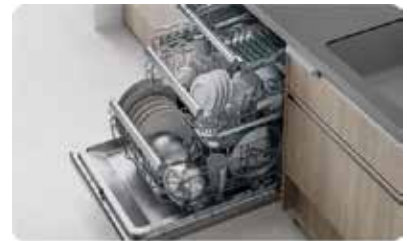
自動で手洗い以上に洗い上げる食洗機。フロントオープンタイプなら、大容量の3段カゴで一度にたっぷり洗えます。