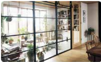
「しきり窓」なら、全面ガラスで広々とした印象そのままに、2つのスペースをつくれます。光を取り込み、リビングまで明るく!