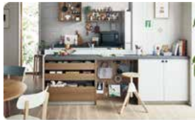
多彩なカップボードアイテムで魅せる収納ができる「EVERY STYLE Furniture」。レイアウトを思いのままに楽しめます。