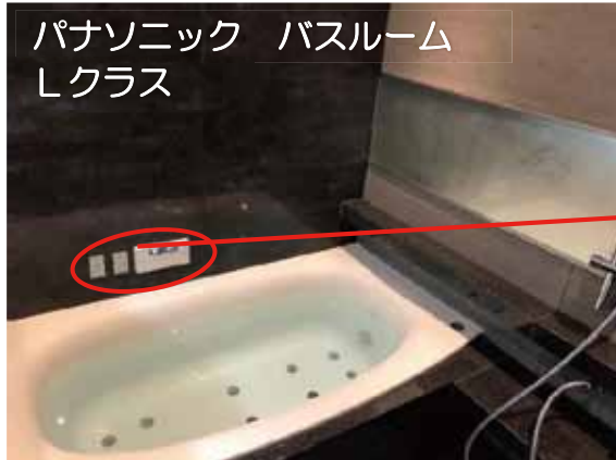
パナソニック バスルーム Lクラス

工事の幅は広く、些細なことから規模が大きいことまであります。 今回は番外編「バスルーム体験」。 先日、パナソニックのバスルームLクラスを導入しています 民泊施設 HATAGO 禅 でリゾートバブル体験入浴をしてきましたのでご紹介します。