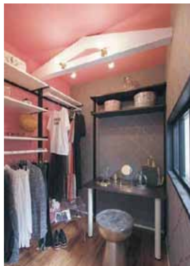
収納空間をアレンジできる「アイシェルフ」

てることが大切です。衣類をたたみたくなければ「吊るす収納」、収納スペースを有効に使いたいなら「たたむ収納」など、お客様の要望を伺いながら最適な収納プランをご提案することが出来ます。