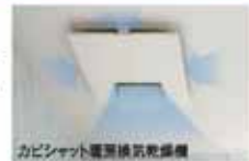
カビシャット暖房換気乾燥機

●しっかり乾燥で、カビを抑えます 浴室をしっかり換気・乾燥するカビシャット 暖房換気乾燥機。さらにカビを抑制する 「ナノイー」搭載タイプも。