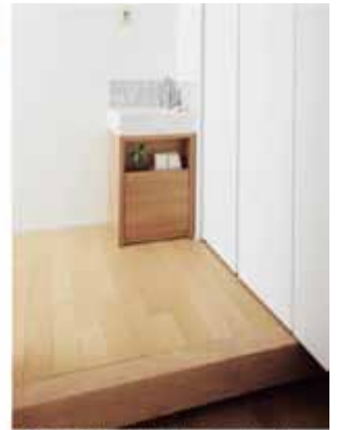
玄関のこんな一角にも洗面コーナーが。