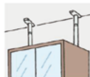
ネジ止めしにくい場所は、 つっぱり棒で固定。