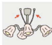
吊り下げ照明器具は チェーンで結ぶ。