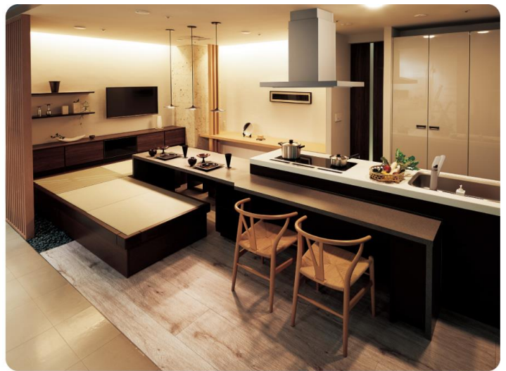
こんなアイランドタイプのキッチンなら、みんなで囲んで作ったりお手伝いもしやすい。ダイニングテーブルを一緒にしたプランなので、その場で作って食べられます。